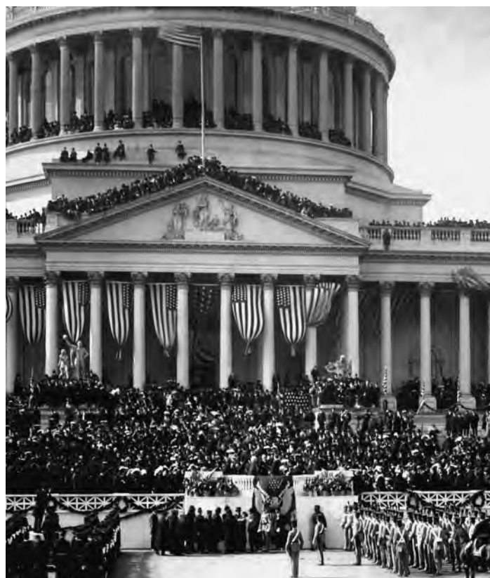
The inauguration of President Theodore Roosevelt on March 4, 1905.

Barack Obama is the 44th president of the United States. He won the presidential election of 2008 and became the first African American president of the United States. As president, he is the head of the executive branch. As commander in chief, he is also in charge of the military. Obama was born in Hawaii on August 4, 1961. He graduated from Columbia University in New York. Obama also studied law and graduated from Harvard University in Massachusetts. He served as a U.S. senator for the state of Illinois before being elected president. President Obama's wife, called "the First Lady," is Michelle Obama.