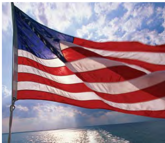
The American flag is an important symbol of the United States.

When the United States became an independent country, the Constitution gave Congress the power to establish a uniform rule of naturalization. Congress made rules about how immigrants could become citizens. Many of these requirements are still valid today, such as the requirements to live in the United States for a specific period of time, to be of good