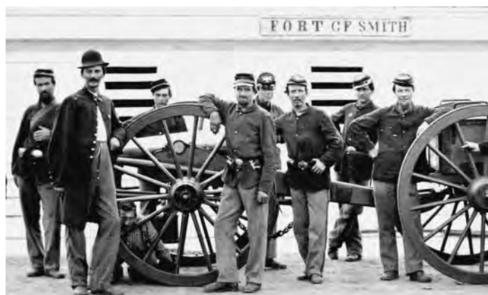
Civil War soldiers with cannon and caisson, Fort C.F. Smith, Co. L, 2d New York Artillery.

The American Civil War is also known as the War between the States. It was a war between the people in the northern states and those in the southern