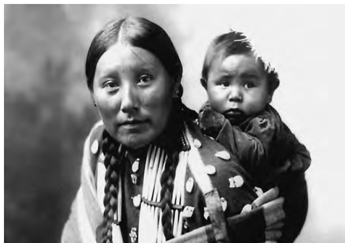
American Indian woman and her baby in 1899. Courtesy of the Library of Congress, LC-USZ62-94927.

On September 11, 2001, four airplanes flying out of U.S. airports were taken over by terrorists from the Al-Qaeda network of Islamic extremists. Two of the planes crashed into the World Trade Center’s Twin Towers in New York City, destroying both buildings. One of the planes crashed into the Pentagon in Arlington, Virginia. The fourth plane, originally aimed at Washington, D.C., crashed in a field in Pennsylvania. Almost 3,000 people died in these attacks, most of them civilians. This was the worst attack on American soil in the history of the nation.