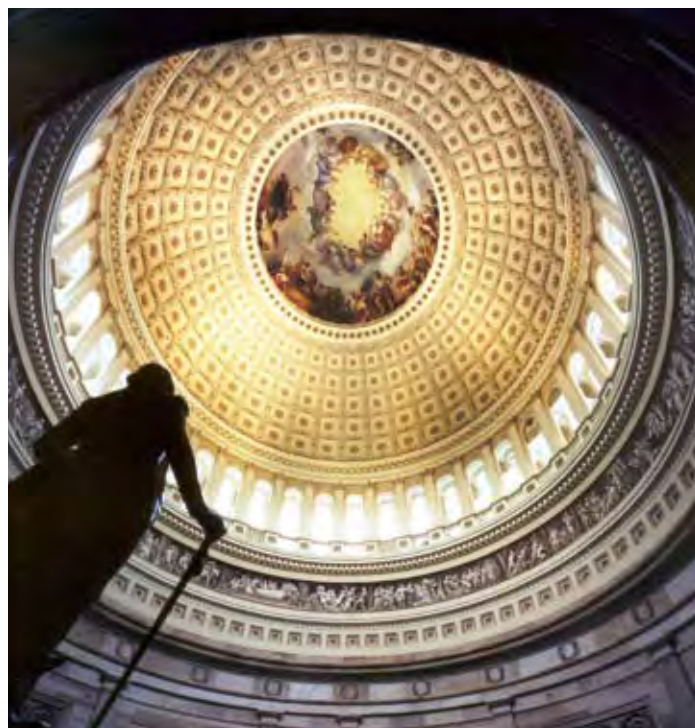
The Rotunda of the U.S. Capitol.

Congress is divided into two parts—the Senate and the House of Representatives. Because it has two “chambers,” the U.S. Congress is known as a “bicameral” legislature. The system of checks and balances works in Congress. Specific powers are assigned to each of these chambers. For example, only the Senate has the power to reject a treaty signed by the president or a person the president chooses to serve on the Supreme Court. Only the House of Representatives has the power to introduce a bill that requires Americans to pay taxes.