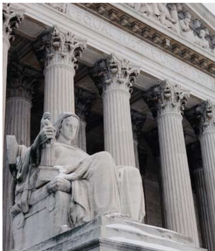
The Contemplation of Justice statue outside the U.S. Supreme Court building in Washington, D.C.

The judicial branch is one of the three branches of government. The Constitution established the judicial