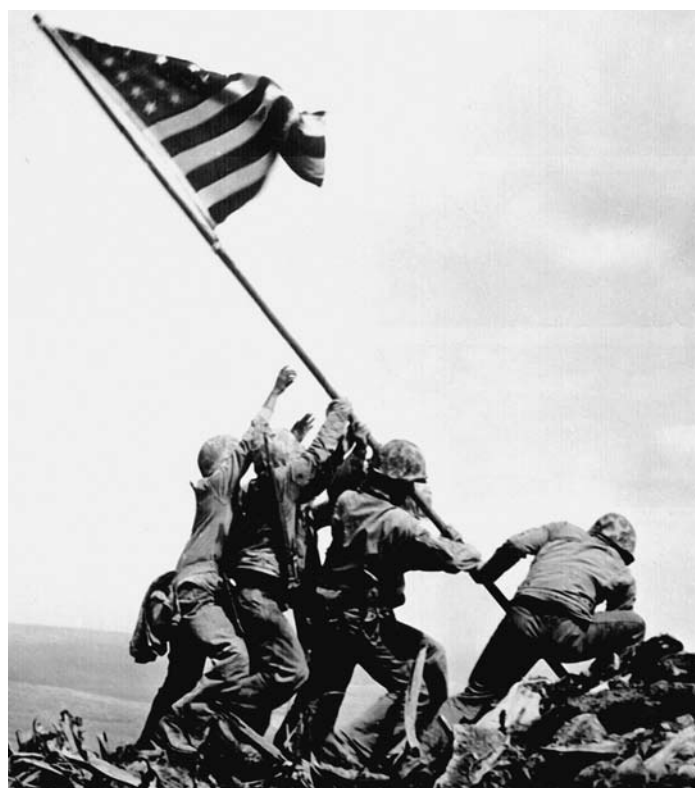
“Raising the Flag on Iwo Jima,” photographed by Joe Rosenthal, Associated Press, 1945.

From 1959 to 1975, United States Armed Forces and the South Vietnamese Army fought against the North Vietnamese in the Vietnam War. The United States supported the democratic government in the south of the country to help it resist pressure from the communist north. The war ended in 1975 with the temporary separation of the country into communist North Vietnam and democratic South Vietnam. In 1976, Vietnam was under total communist control.