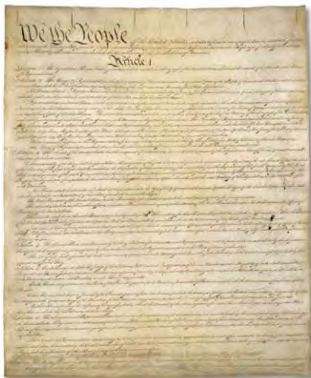
The Constitution of the United States.

The Constitution, written in 1787, created a new system of U.S. government—the same system we have today. James Madison was the main writer of the Constitution. He became the fourth president of the United States. The U.S. Constitution is short, but it defines the principles of government and the rights of citizens in the United States. The document has a preamble and seven articles. Since its adoption, the Constitution has been amended (changed) 27 times. Three-fourths of the states (9 of the original 13) were required to ratify (approve) the Constitution. Delaware was the first state to ratify the Constitution on December 7, 1787. In 1788, New Hampshire was the ninth state to ratify the Constitution. On March 4, 1789, the Constitution took effect and Congress met for the first time. George Washington was inaugurated as president the same year. By 1790, all 13 states had ratified the Constitution.