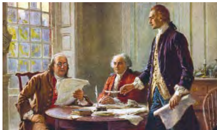
Benjamin Franklin, John Adams, and Thomas Jefferson in “Writing the Declaration of Independence, 1776,” by Jean Leon Gerome Ferris.

The Declaration of Independence lists three rights that the Founding Fathers considered to be natural and “unalienable.” They are the right to life, liberty, and the pursuit of happiness. These ideas about freedom and individual rights were the basis for declaring America’s independence. Thomas Jefferson and the other Founding Fathers believed that people are born with natural rights that no government can take away. Government exists to protect these rights. Because the people voluntarily give up power to a government, they can take that power back. The British government was not protecting the rights of the colonists, so the colonies took back their power and separated from Great Britain.