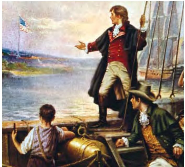
In “The Star-Spangled Banner,” by Percy Moran, Francis Scott Key reaches toward the flag flying over Fort McHenry.

In the United States, we celebrate Independence Day on July 4 to mark the anniversary of the adoption of the Declaration of Independence. After signing the Declaration of Independence, John Adams wrote to his wife, “I am apt to believe that it will be celebrated, by succeeding Generations, as the great anniversary Festival.” The Declaration of Independence, written by Thomas Jefferson, explained why the colonies had decided to separate from Great Britain. Americans celebrate the Fourth of July as the birthday of America, with parades, fireworks, patriotic songs, and readings of the Declaration of Independence.