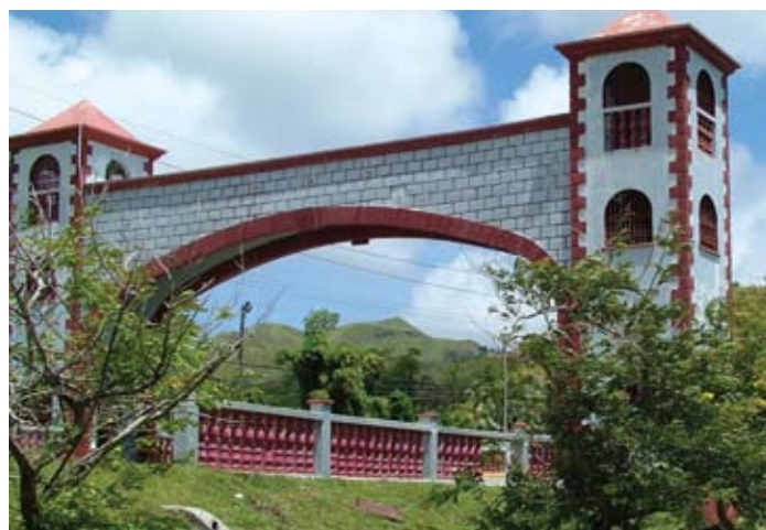
Old Spanish Bridge in Umatat, Guam.

The northern border of the United States stretches more than 5,000 miles from Maine in the East to Alaska in the West. There are 13 states on the border with Canada. The Treaty of Paris of 1783 established the official boundary between Canada and the United States after the Revolutionary War. Since that time, there have been land disputes, but they have been resolved through treaties. The International Boundary Commission, which is headed by two commissioners, one American and one Canadian, is responsible for maintaining the boundary.