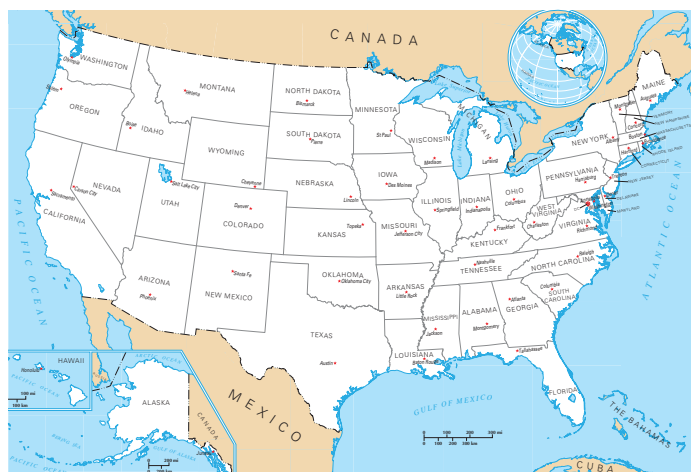
Map of the United States including state capitals.

The Constitution did not establish political parties. President George Washington specifically warned against them. But early in U.S. history, two political