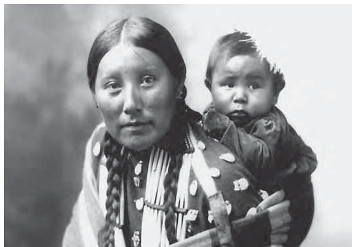
American Indian woman and her baby in 1899. Courtesy of the Library of Congress, LC-USZ62-94927.

On September 11, 2001, four airplanes flying out of U.S. airports were taken over by terrorists from the Al-Qaeda network of Islamic extremists. Two of the planes crashed into the World Trade Center’s Twin Towers in New York City, destroying both buildings. One of the planes crashed into the Pentagon in Arlington, Virginia. The fourth plane, originally aimed at Washington, D.C., crashed in a field in Pennsylvania. Almost 3,000 people died in these attacks, most of them civilians. This was the worst attack on American soil in the history of the nation.