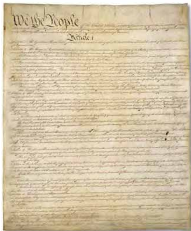
The Constitution of the United States.

The Constitutional Convention was held in Philadelphia, Pennsylvania, from May to September 1787. Fifty-five delegates from 12 of the original 13 states (except for Rhode Island) met to write amendments to the Articles of Confederation. The delegates met because many American leaders did not like the Articles. The national government under the Articles of Confederation was not strong enough. Instead of changing the Articles of Confederation, the delegates decided to create a new governing document with a stronger national government—the Constitution. Each state sent delegates, who worked for four months in secret to allow for free and open discussion as they wrote the new document. The delegates who attended the Constitutional Convention are called “the Framers.” On September 17, 1787, 39 of the delegates signed the new Constitution.