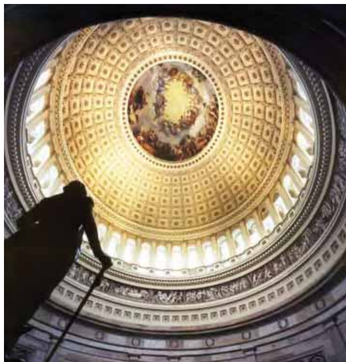
The Rotunda of the U.S. Capitol.

Congress is divided into two parts—the Senate and the House of Representatives. Because it has two “chambers,” the U.S. Congress is known as a “bicameral” legislature. The system of checks and balances works in Congress. Specific powers are assigned to each of these chambers. For example, only the Senate has the power to reject a treaty signed by the president or a person the president chooses to serve on the Supreme Court. Only the House of Representatives has the power to introduce a bill that requires Americans to pay taxes.