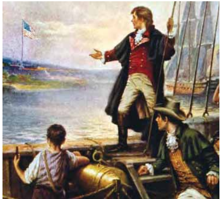
In "The Star-Spangled Banner," by Percy Moran, Francis Scott Key reaches toward the flag flying over Fort McHenry.

Many Americans celebrate national or federal holidays. These holidays often honor people or events in our American heritage. These holidays are "national" in a legal sense only for federal institutions and in the District of Columbia. Typically, federal offices are closed on these holidays. Each state can decide whether or not to celebrate the holiday. Businesses, schools, and commercial establishments may choose whether or not to close on these days. Since 1971, federal holidays are observed on Mondays except for New Year's Day, Independence Day, Veterans Day, Thanksgiving, and Christmas.