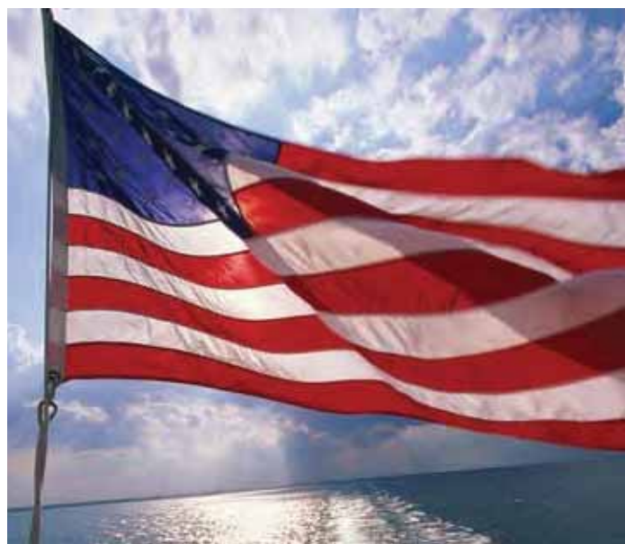
The American flag is an important symbol of the United States.

When the United States became an independent country, the Constitution gave Congress the power to establish a uniform rule of naturalization. Congress made rules about how immigrants could become citizens. Many of these requirements are still valid today, such as the requirements to live in the United States for a specific period of time, to be of good