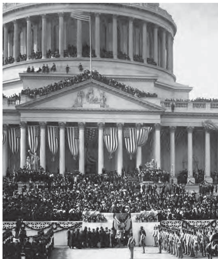
The inauguration of President Theodore Roosevelt on March 4, 1905.

Barack Obama is the 44th president of the United States. He won the presidential election of 2008 and became the first African American president of the United States. As president, he is the head of the executive branch. As commander in chief, he is also in charge of the military. Obama was born in Hawaii on August 4, 1961. He graduated from Columbia University in New York. Obama also studied law and graduated from Harvard University in Massachusetts. He served as a U.S. senator for the state of Illinois before being elected president. President Obama's wife, called "the First Lady," is Michelle Obama.