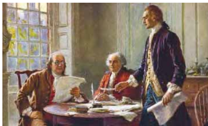
Benjamin Franklin, John Adams, and Thomas Jefferson in “Writing the Declaration of Independence, 1776,” by Jean Leon Gerome Ferris.

The Declaration of Independence lists three rights that the Founding Fathers considered to be natural and “unalienable.” They are the right to life, liberty, and the pursuit of happiness. These ideas about freedom and individual rights were the basis for declaring America’s independence. Thomas Jefferson and the other Founding Fathers believed that people are born with natural rights that no government can take away. Government exists to protect these rights. Because the people voluntarily give up power to a government, they can take that power back. The British government was not protecting the rights of the colonists, so the colonies took back their power and separated from Great Britain.