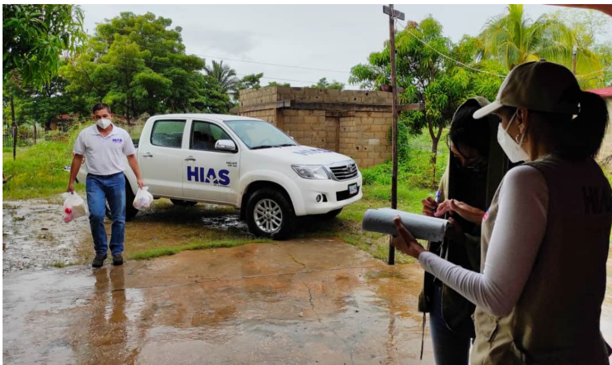
Los asistentes sociales de HIAS en el estado de Zulia entregan asistencia alimentaria a una sobreviviente de VBG en noviembre de 2020.

HIAS Venezuela trabaja de forma cercana con ACNUR y sus socios, y seguirá colaborando con ONG internacionales, organizaciones locales, el sector privado y otros actores clave que apoyan a refugiados y solicitantes de asilo. HIAS Venezuela participa en grupos de trabajo de coordinación humanitaria a nivel nacional y regional, comparte datos de los programas y de evaluaciones, y coordina respuestas a vacíos y a necesidades emergentes. A nivel nacional, HIAS Venezuela participa en todos los clústeres y grupos establecidos a través del Plan de Respuesta Humanitaria, así como, en los espacios de coordinación liderados por OCHA y el Foro de Organizaciones Humanitarias Internacionales en Venezuela. HIAS Venezuela también trabaja de forma articulada con la Comisión Nacional para los Refugiados (CONARE) en Venezuela. HIAS Venezuela continuará fortaleciendo sus asociaciones con organizaciones locales, incluidos grupos liderados por mujeres para profundizar y sostener el impacto.