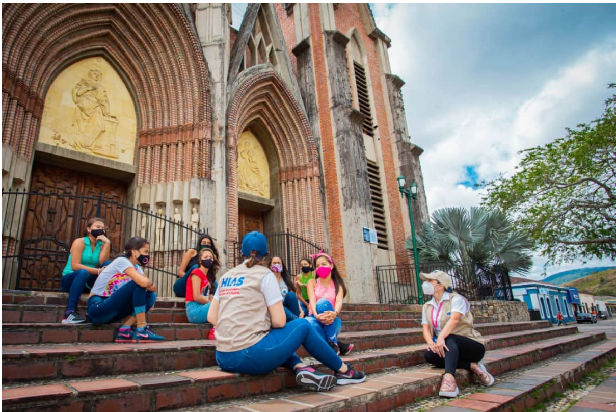
Un grupo de adolescentes participó en una sesión interactiva junto con gestores de casos y facilitadores de capacitación de HIAS en febrero de 2021.

El programa de prevención y respuesta a la VBG de HIAS Venezuela provee servicios de gestión de casos y apoyo de emergencia para sobrevivientes de VBG. HIAS Venezuela proporciona asistencia psicosocial, en salud y , kits de higiene, protección legal, apoyo en transporte y vivienda, así como, derivaciones a otros servicios cuando es necesario. También realiza capacitación y trabaja con organizaciones locales en la respuesta a las personas sobrevivientes.; también realiza d . HIAS Venezuela también colabora con las personas sobrevivientes de VBG para diseñar e implementar actividades culturales y recreativas, crear espacios seguros y de acogimiento que se vinculen con los sistemas de apoyo existentes en sus comunidades. Además, HIAS Venezuela trabaja en diferentes áreas programáticas con mujeres y adolescentes para promover su empoderamiento y reducir los riesgos de VBG. HIAS Venezuela también trabaja con hombres, de manera de involucrarlos como aliados clave en la prevención y reducción del riesgo de VBG.