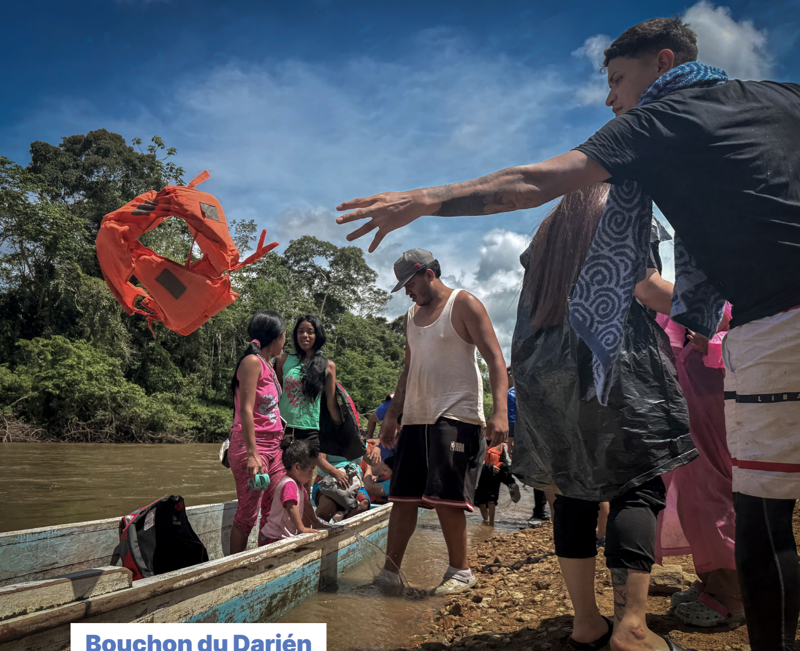
Bouchon du Darién