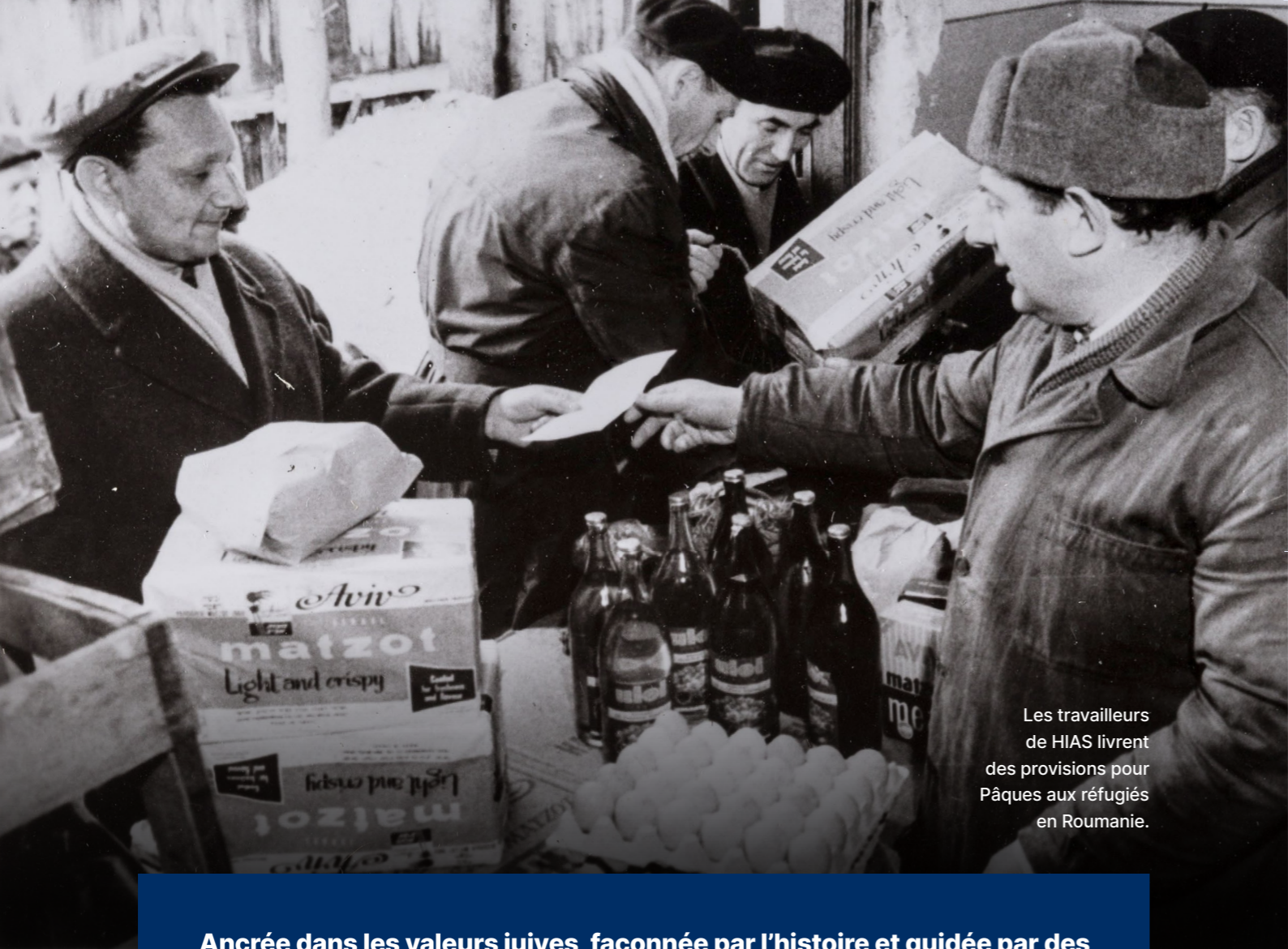
Les travailleurs de HIAS livrent des provisions pour Pâques aux réfugiés en Roumanie.

Ancrée dans les valeurs juives, façonnée par l'histoire et guidée par des principes humanitaires, HIAS apporte un soutien essentiel aux personnes déplacées à travers le monde. Nous aidons les personnes touchées par des crises à reconstruire leur vie dans la sécurité et la dignité, tout en défendant leurs droits et leur inclusion.