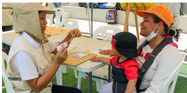
Examen nutricional de niños migrantes en Perú.

El equipo de seguridad alimentaria y nutrición (SAN) de HIAS está formado por expertos técnicos con amplia experiencia global, regional y específica de cada país. El equipo establece y orienta la estrategia de HIAS para SAN y proporciona apoyo técnico como el fortalecimiento de capacidades y el desarrollo de conocimientos, para garantizar que los programas se alineen con estándares internacionales, buenas prácticas y principios institucionales.