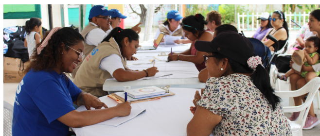
Participantes reciben kits de higiene y asistencia monetaria en Pasaje, Ecuador, 3 de abril, 2023.

El equipo está compuesto por asesores técnicos, especialistas, coordinadores y equipos de campo con amplia experiencia a nivel global, regional y específica de cada país. El equipo establece y orienta la estrategia de HIAS para la modalidad de transferencias monetarias y brinda apoyo técnico, incluido el fortalecimiento de capacidades y la generación de conocimiento, para garantizar que la programación se alinee con estándares internacionales, buenas prácticas y principios institucionales.